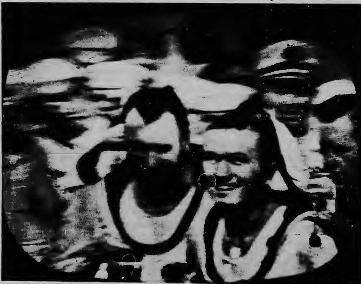
BORDO DI USS WASP: E astronautanan James Lovell, na man robes, y Frank Borman aki ta cana a bordo di e avion sin qu nan tabatin mester di asistencia despues qu nan a ser sacá for di Oceano Atlantico caminda nan a hasi un aterrizaje normal cu nan capsula espacial Geminis-7.

Un avion a avisa: "Tur cos ta luci bon".